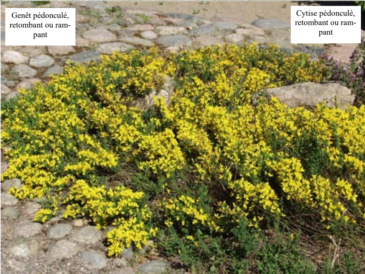
Genêt pédonculé, retombant ou rampant